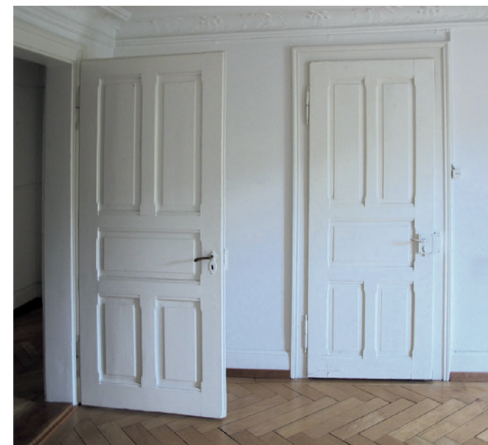
Diese Türen warten noch auf ihren Einsatz.

Durch die Verwendung von alten Stiltüren wird der Wohnung auch eine einzigartige Atmosphäre verliehen. Jede Linie bereichert die Wahrnehmung und gemeinsam werden sie zu einem echten Erlebnis.